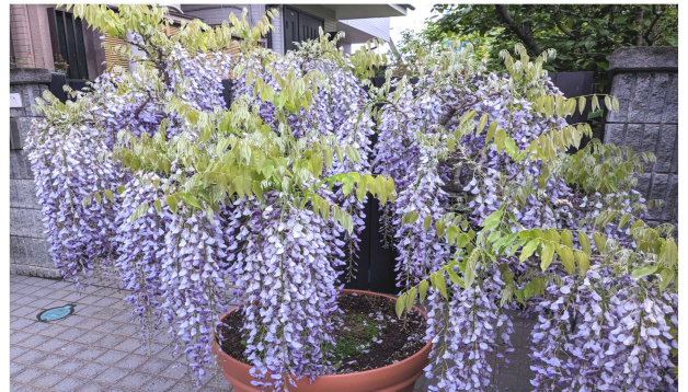
たわわに下がる藤の花。大きな鉢植えにしっかりと（風渡野の原田宅）