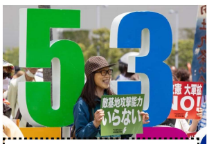
参加したとば市議

憲法は、時の政権が暴走しないよう主権者である国民が権力者を縛るためにあるものです。憲法を守り、戦争にさせない外交努力を今こそ発揮すべき時であり、平和こそ守り通すべきものです。日本共産党は暮らしの隅々にまで憲法がいきわたるまで党の総力をあげる決意です。